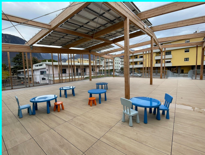
TERRAZZO E ORTO VERTICALE